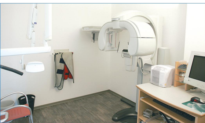
Moderne, strahlungsarme Geräte ermöglichen zum Beispiel dreidimensionale „Röntgenbilder“.